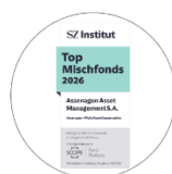
SZ Institut Top Mischfonds 2026 Anteilsklasse P