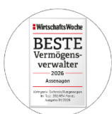
WirtschaftsWoche BESTE Vermögensverwalter 2026