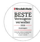
WirtschaftsWoche BESTE Vermögensverwalter 2026 Assenagon